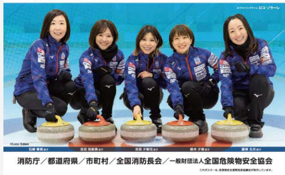
女子カーリングチーム「ロコ・ソラーレ」