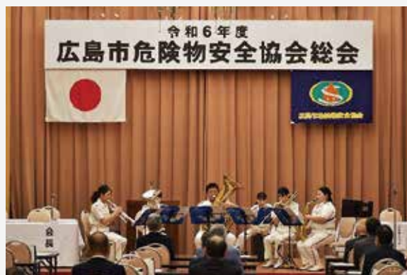
広島市消防音楽隊による演奏