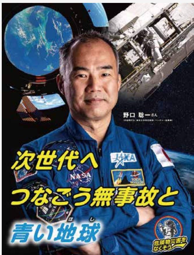
野口 聡一 宇宙飛行士